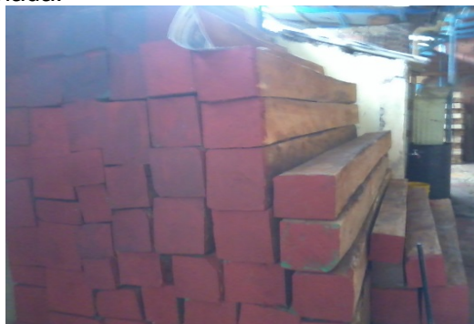
Foto N°. 01 Fachada del predio donde funciona la empresa DEPOSITO DE MADERAS NUEVO PLAYON

Foto N°. 02 – Saldo de Cedro ( Cedrela odorata ) inventariado en el momento de la visita.